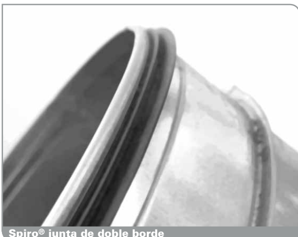
Spiro® junta de doble borde