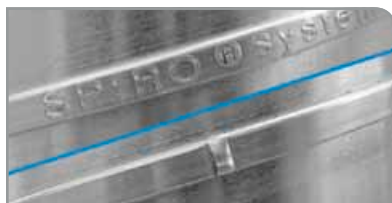
Grabado individual/Juntura de bloqueo fija

Diferentes configuraciones para potenciar las capacidades de producción