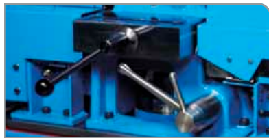
Sistema de cierre rápido

Corte superior/mínimo mantenimiento/fácil configuración