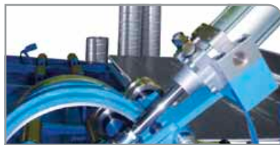
Automatic unidad de corrugado

Pantalla sencilla de manejar para el usuario con una interfaz para la red e Internet, herramienta de diagnóstico y función multilingüe