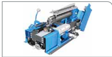
Slitter Modelo H

Unidad estándar con cilindros de acero de la máxima calidad