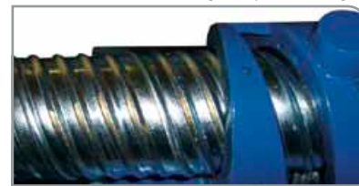
Aplicación tensionado posterior

Refuerce sus conductos con dimensiones >250 mm