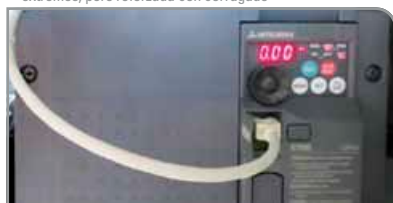
Configuración del accionamiento

Aplicaciones de conductos especiales para la industria de la construcción