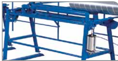
Mesa de salida estándar

Aumenta la capacidad de producción hasta un 30 %