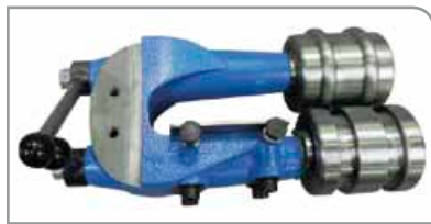
Unidad estándar de corrugado

Produce conductos con una superficie interior lisa en los extremos, pero reforzada con corrugado