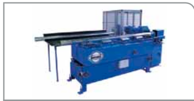
Spiro® Speed Carrier (SSC)

Aumenta la capacidad de producción hasta un 30 %