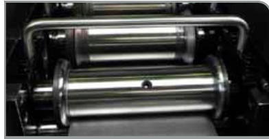
Sistema de cassette

Desbobinador estándar con capacidad de carga de máx. 1000 kg