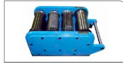
Unidad de cilindro de moldeo

Unidad estándar con cilindros de acero de la máxima calidad