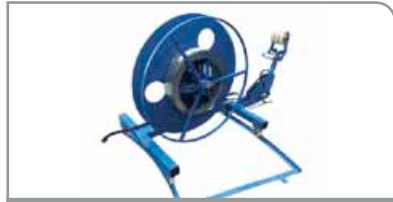
Vertical Desbobinador DCV-1000

Desbobinador estándar con capacidad de carga de máx. 1000 kg