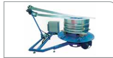
Horizontal Desbobinador DCH-3000

longitud del conducto de hasta 3 m, incluye descarga automática