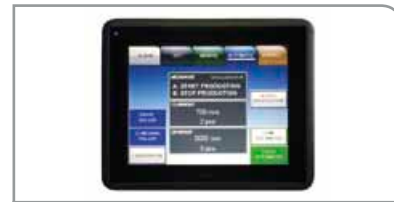
Interfaz de usuario vanguardista

Cambio rápido opcional de los cabezales de moldeo